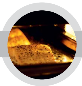
Mäkké filé z ryby s prirodzenou chuťou