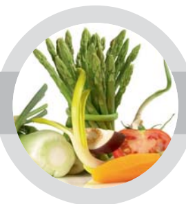
Nové možnosti všestrannej diéty

Najmä vďaka tomu, že je koncept 3 v 1 parnej rúry Sharp navrhnutý tak dômyselne, že vaše potreby môžu byť splnené aj bez stresu v každodennom živote, ktorý je stále zložitejší. To znamená, že odteraz môžete pripraviť vyvážené jedlá plné vitamínov a vysokou nutričnou hodnotou, ktoré sú navyše chutné. Pre pekný večer s priateľmi , pre osamote žijúcich , ktorí predstierajú, že variť pre jedného sa neoplatí, pre ľudí, ktorým záleží na zdraví , ktorí chcú jesť to najzdravšie, pre ľudí, ktorí musia zo zdravotných dôvodov pripravovať svoje jedlo zdravo, pre matky a otcov, ktorí chcú rôzne jedlá pre svoju rodinu alebo pre labužníkov , ktorí jednoducho radi varia a ochutnávajú. To je to, čo spoločnosť Sharp rozumie pod pojmom INTELIGENTNÉ VARENIE .