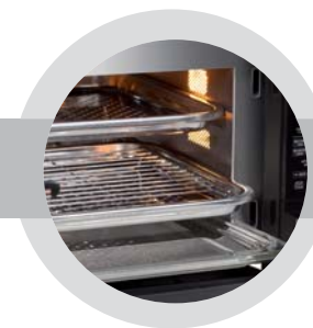
27-litrová varná komora z nehrdzavejúcej ocele vyžadujúca málo údržby