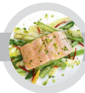
Teraz už nikdy nič nespálite!